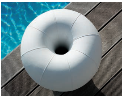
Q-Stool / Danny Venlet