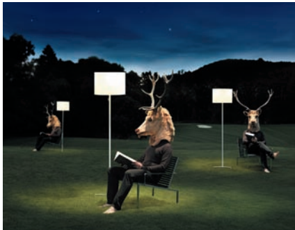
Lounge Chair high & Zoe Solar / Wolfgang Pichler