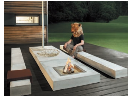
Viteo Cementum Collection / Wolfgang Pichler