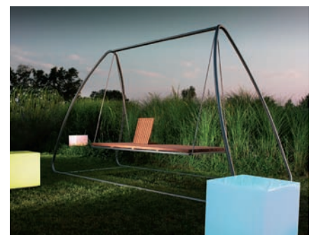
Swing & Light Cube / Wolfgang Pichler