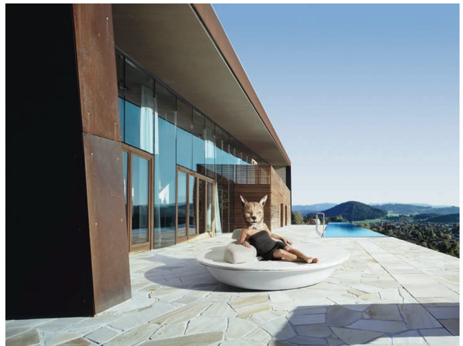
Ljlo / Danny Venlet