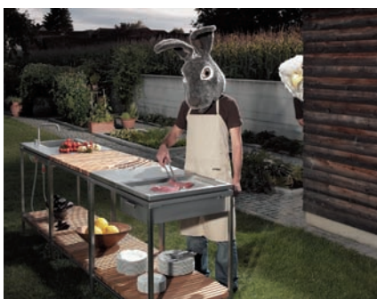
Outdoor Kitchen / Wolfgang Pichler