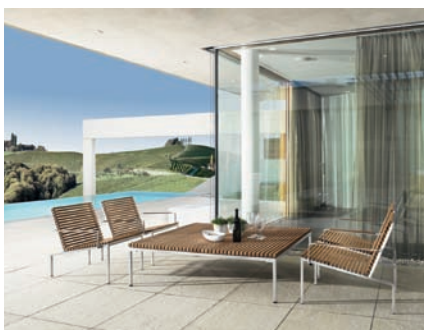
Lounge Chair high & Table 140 / Wolfgang Pichler